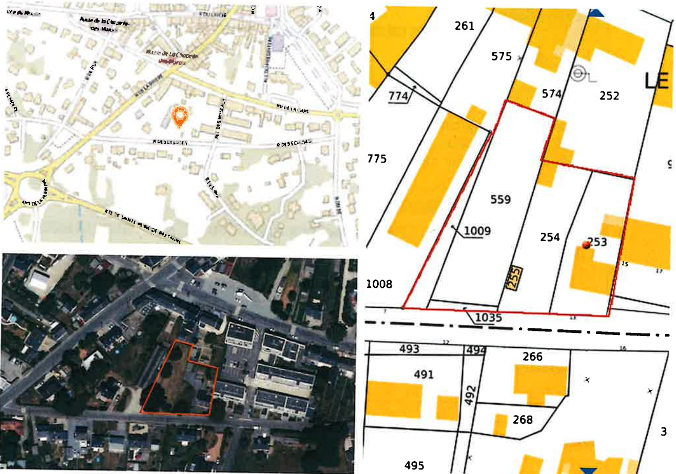
Plan de situation et intégration du projet dans son environnement

Silène est chargé d'une opération de construction de 14 logements collectifs et individuels nommée « Les Drides » pour une surface plancher de 881,97 m 2 , rue des écluses à La Chapelle des Marais. La commande était initialement de réaliser 13 logements pour une SDP d'environ 850m 2 . L'évolution de l'opération a été approuvée tant par l'Agglomération que par la Commune de la Chapelle des Marais.